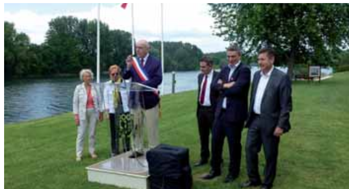
Inauguration du Square Édith PIAF - Théo Sarapo