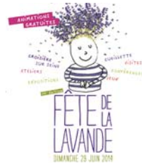
Fête de la Lavande