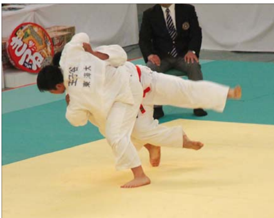
championnats du Japon toutes catégorie, le O Soto Gari gagnant de OJATANI en finale