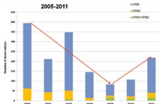
Evolution du nombre de plaintes annuelles depuis 2005 Extrait document SIAAP

UPBE : Traitement des eaux (face à La Frette) UPBD : Traitement des boues (face à Herblay)