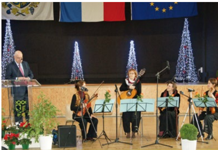
Extraits du discours de M. le Maire

Dans cette période économique et sociale délicate, la municipalité est aux côtés des Frettois pour les aider dans leur vie quotidienne, pour garantir autant que possible leur sécurité et pour préserver leur environnement. C'est depuis toujours le fil rouge de notre action et cela le restera en 2012.